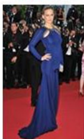
Бар Рафаэли в платье Roberto Cavalli