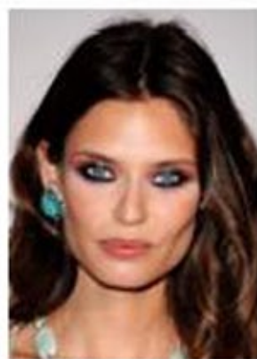
У Бьянки Балти необычный насыщенный макияж глаз. Вам нравится?